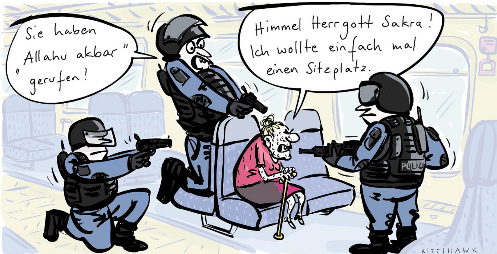
KITTIHAWK Terror im Regionalexpress

Vielleicht haben wir ja Glück und die Flüchtlinge nehmen uns wirklich unsere Frauen weg.