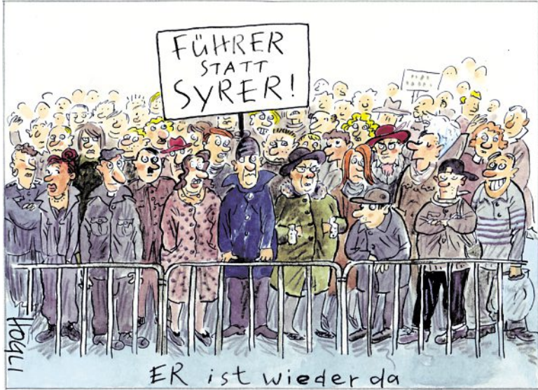
Hogli Er ist wieder da