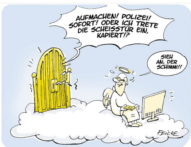
FEICKE Schimanski im Himmel