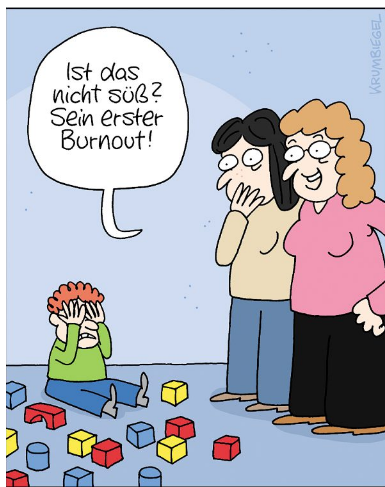
UWE KRUMBIEGEL Diagnose im Kinderzimmer