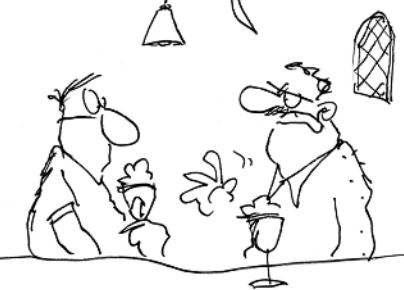
HAUCK & BAUER Wir schaffen das

Vielleicht haben wir ja Glück und die Flüchtlinge nehmen uns wirklich unsere Frauen weg.